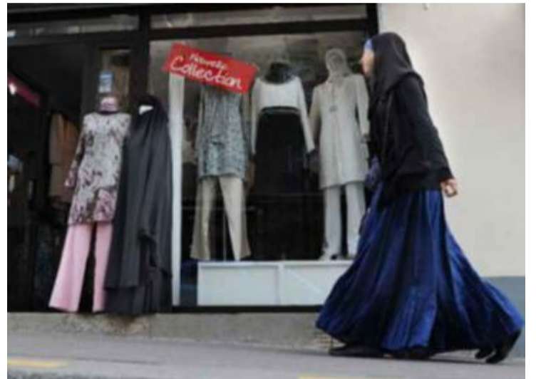
HIJAB: «Jeg ser heller at kvinner ifører seg hijab enn at våre mest rabiate rødstrømper skal vinne frem med sine visjoner», skriver artikkelforfatteren.